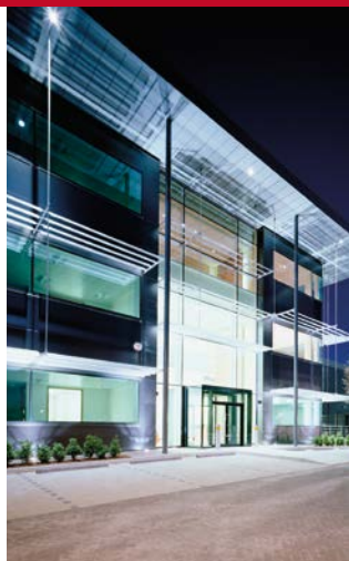
West London, United Kingdom